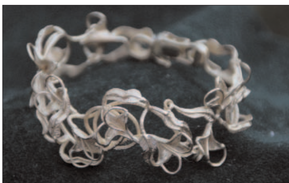
Il bracciale presentato in Abruzzo

I corsi frequentati presso la Scuola orafa di Rivello sono stati per me di fondamentale importanza e altamente formativi. In questo scuola ho avuto la possibilità di acquisire le prime conoscenze sui materiali che vengono lavorati e usati per le creazioni orafe. Ho acquisito così le nozioni di durezza e malleabilità dell'oro e dell'argento, oltre ad inserirmi nel mondo dell'arte pratica, figurata e scoltata. Presso la Scuola Orafa di Rivello mi è stato insegnato come da una lastra di metallo si ricava e si dà vita e corpo ad un gioiello. Come e quando ti sei accorto di questa tua passione e