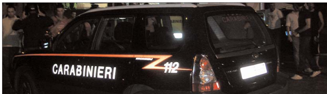
I Carabinieri hanno dovuto riportare ordine

"Purtroppo è finita male, quella che doveva essere la serata più bella ed emozionante si è rivelata uno spettacolo da non rivedere, tutto ciò rischia di far passare in secondo piano l'impegno dei ragazzi che hanno organizzato il torneo, questo non è giusto! 20 squadre, 160 giocatori, 54 partite sono numeri che difficilmente si vedono nei tornei...."