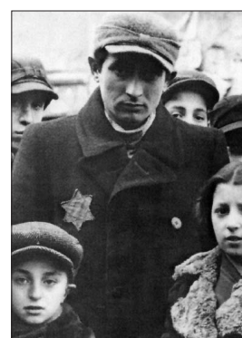
Un'immagine della Shoah

mo. Oggi, questa data deve indicare a noi tutti la speranza e la volontà di non dimenticare. La Shoah è una macchia indelebile della storia del nostro secolo. Questa indicibile tragedia, lo sterminio programmato del popolo ebraico da parte dei nazisti, non potrà mai essere dimenticata. Tutti abbiamo il dovere della memoria contro qualsiasi revisionismo storico, affinché si possa tenere sempre presente di quali azioni abiette possa essere capace l'uomo quando disprezza l'immagine di Dio che è in lui ed in ogni altro