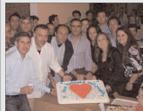
Foto di gruppo dei promotori dell'iniziativa politica